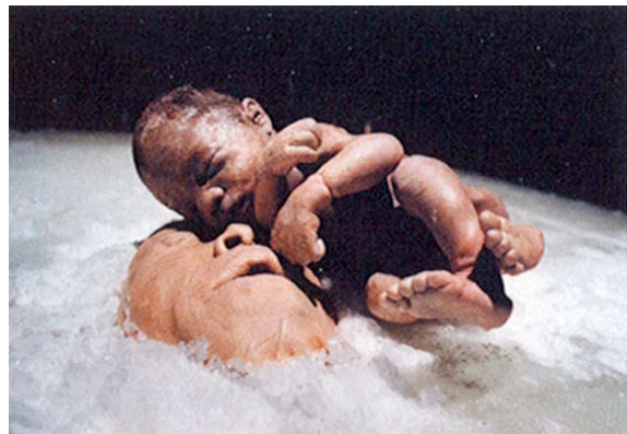
Sun Yuan, Honey, 1999, Farbfotografie

Für Xian Yu ist die Kunst wie ein Thermometer das Windpocken am Körper auslösen kann. Diese Symptome der Gefühle regen den Betrachter zum Nachdenken an, sind aber nicht tödlich.