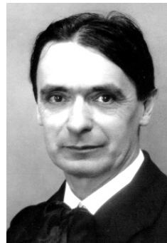
Rudolf Steiner (1861-1925)

In seinem Buch, das er vor seiner Zeit als Anthroposoph geschrieben hat, geht es um die Grundzüge einer modernen Weltanschauung und die seelische Beobachtungsergebnisse nach naturwissenschaftlicher Methode.