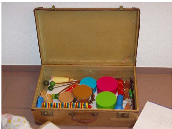
Klangkoffer Abb. 1-3