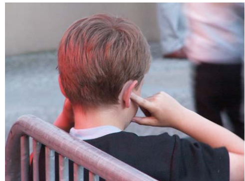
Reizüberflutung Abb. 4

Insbesondere Kinder sind von den ständig eintreffenden akustischen Sinnesreizen oft überfordert und werden regelrecht von ihnen zugeschüttet. Dies hat zur Folge, dass das Zuhören den Kindern schwer fällt. Jedoch ist gerade die Fähigkeit des Zuhörens für Kinder von enormer Bedeutung fürs Lernen. Um den Gehörsinn richtig einsetzen zu können, müssen die Kinder zuerst lernen zu differenzieren, neue Reize mit bereits bekannten zu vergleichen und schliesslich sowohl fokussiert wie auch peripher zu hören. Erst wenn die Angst und das Unbehagen vor der Geräuschkulisse eingedämmt werden können, ist eine ersichtliche Freude am Spiel mit den Geräuschen und Klängen möglich. Wichtig für die Entdeckung der Geräusch- und Klangwelt ist eine möglichst ruhige Umgebung, damit es nicht zu einer Reizüberflutung kommt, was wiederum eine Einschüchterung des Kindes zur Folge hätte. Die Kinder brauchen Unterstützung bei der Öffnung ihrer Ohren für ihre Umwelt und das genaue Hinhören. Wenn Kinder mit dem Hörsinn positive Erfahrungen machen, so können bestimmte Geräusche und Klänge sie beruhigen und ihnen Geborgenheit vermitteln.