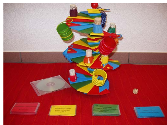
Klangtreppe Abb. 6

Für die Gestaltung der Spiele nahm ich mir bewusst viel Zeit. Ich denke, wenn man ein wirklich überzeugendes Produkt herstellen möchte, ist die Art, wie man an die Arbeit herangeht, ein sehr wichtiger Bestandteil des Ganzen. Da das Brettspiel (Abb. 6) am zeitaufwändigsten war, beschloss ich, dieses Spiel zuerst anzugehen. Nach der Vollendung dieses Spiels war ich einen grossen Schritt vorangekommen, was mir einen weiteren Motivationsschub verlieh.