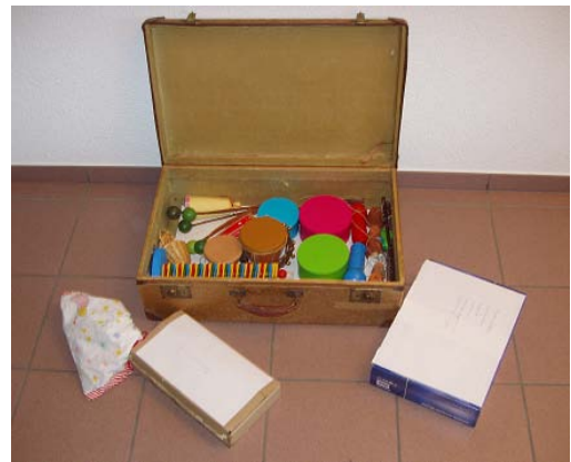
Klangkoffer Abb. 5

Von Anfang an war für mich eigentlich klar, dass ich die Objekte meiner Hörschule alle komplett in einem Klangkoffer (Abb. 5) zusammengefasst haben wollte. Mir war dieser Punkt sehr wichtig, weil 'Ohrenspitzer' dadurch jeder Person die Gelegenheit bietet, an seinem Gehör oder demjenigen eines Kindes zu arbeiten ohne viel Zeit für die Materialsuche aufzuwenden. Durch 'Ohrenspitzer' wird die Gehörbildung deutlich vereinfacht und für den Benutzer der Hörschule bedeutet dieser Klangkoffer auch eine Zeitersparnis.