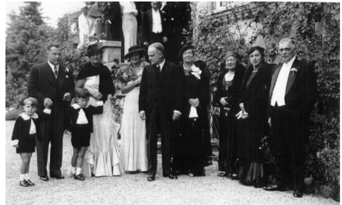
Paul und Lily Klee mit Hochzeitsgesellschaft vor der Villa Lüthi, 1934